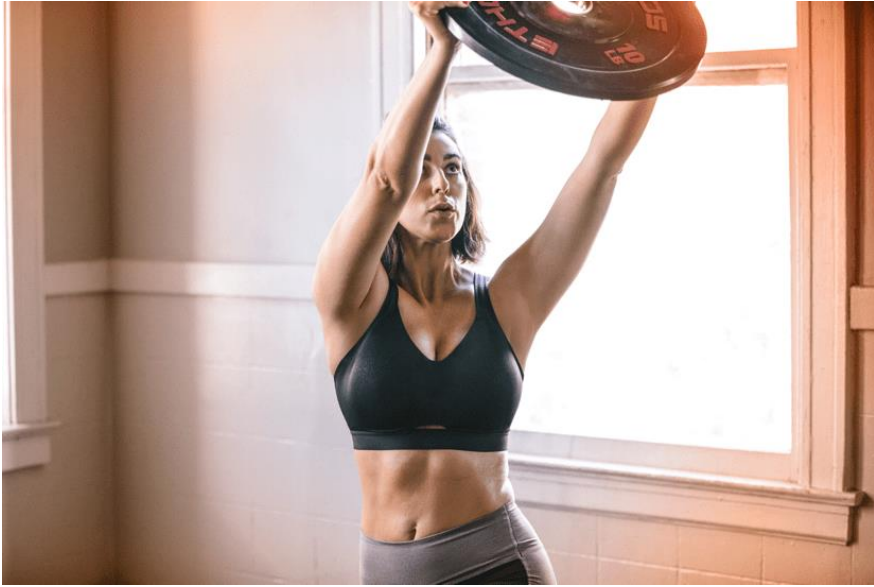
Erős tartást adó melltartó: Stronger for It