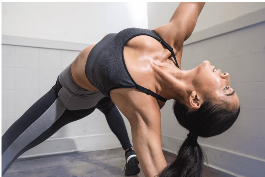
Enyhe tartást adó melltartó: All Me