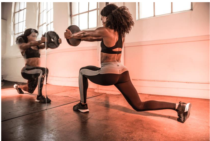
Közepes tartást adó melltartó: Don't Rest